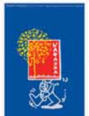
長岡花火がポスターに!