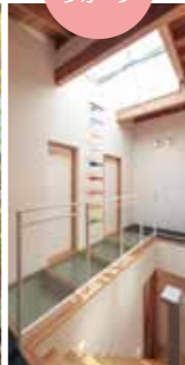
キャットウォーク