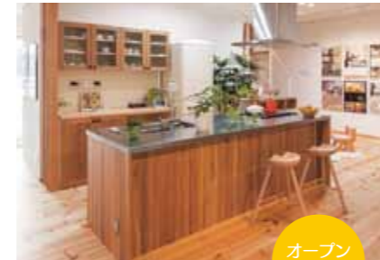
オープンキッチン

お蔭さまで、新潟営業所の新社屋が竣工しました。プロジェクトの名は「Another Rocket(アナザーロケット)」。 皆様と一緒に未来へ歩むため、強・用・美を意識し、様々なアイデアをセレクトしました。オフィスでありながらオフィスらしくない。誰もが訪れたとき、癒される空間です。 「Another Rocket」な冒険の第一歩を皆様と一緒に歩み始めたいと思います。お近くにお越しの際は是非お立ち寄り下さい。