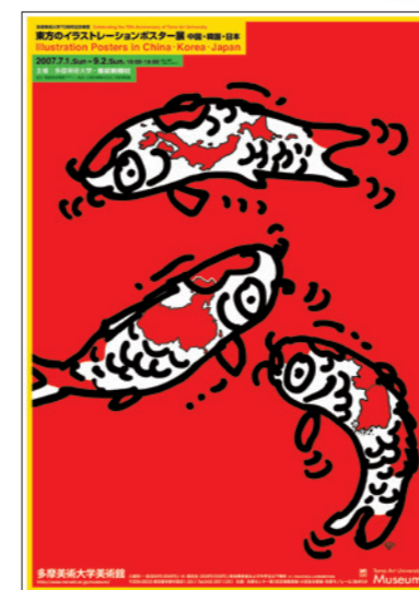
東方のイラストレーションポスター展 中国・韓国・日本 / 2007