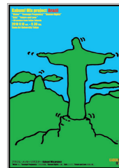
KABUM! Mix / 2010