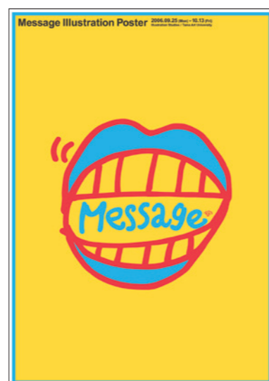
メッセージイラストレーションポスター展 / 2006