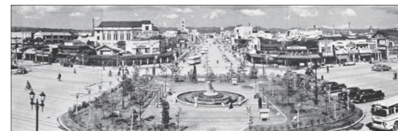
長岡駅前の平和像と大手通り (昭和 30 年)