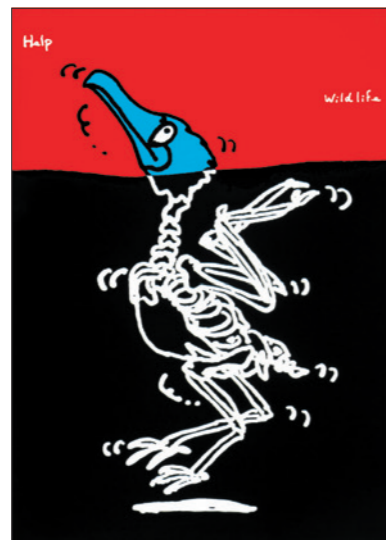
Wild Life Help (oil bird) / 1991