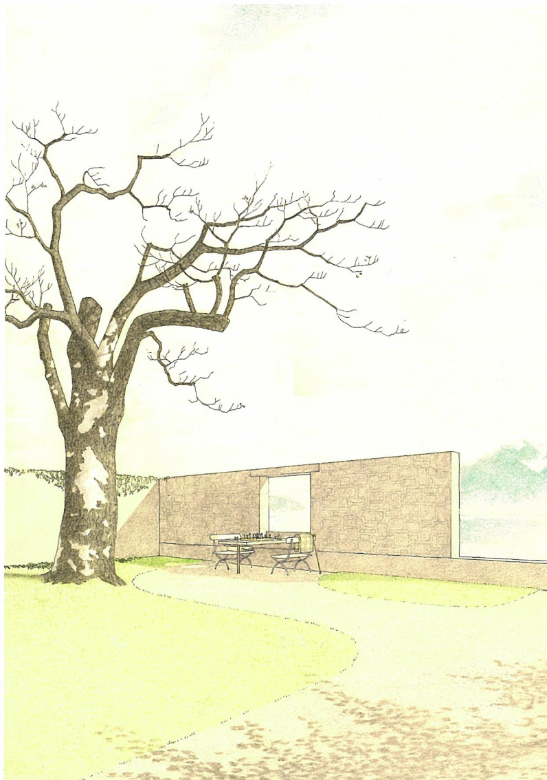
イラスト：山本卓郎／山本卓郎建築設計事務所