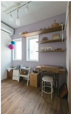
自然素材の雑貨や小物で彩られた、約3畳の奥様の趣味室。「ここで裁縫をしたり、アイロンを掛けたり。プリンタをこの部屋に置いているので、写真のプリントなどもここでしています」(奥様)。