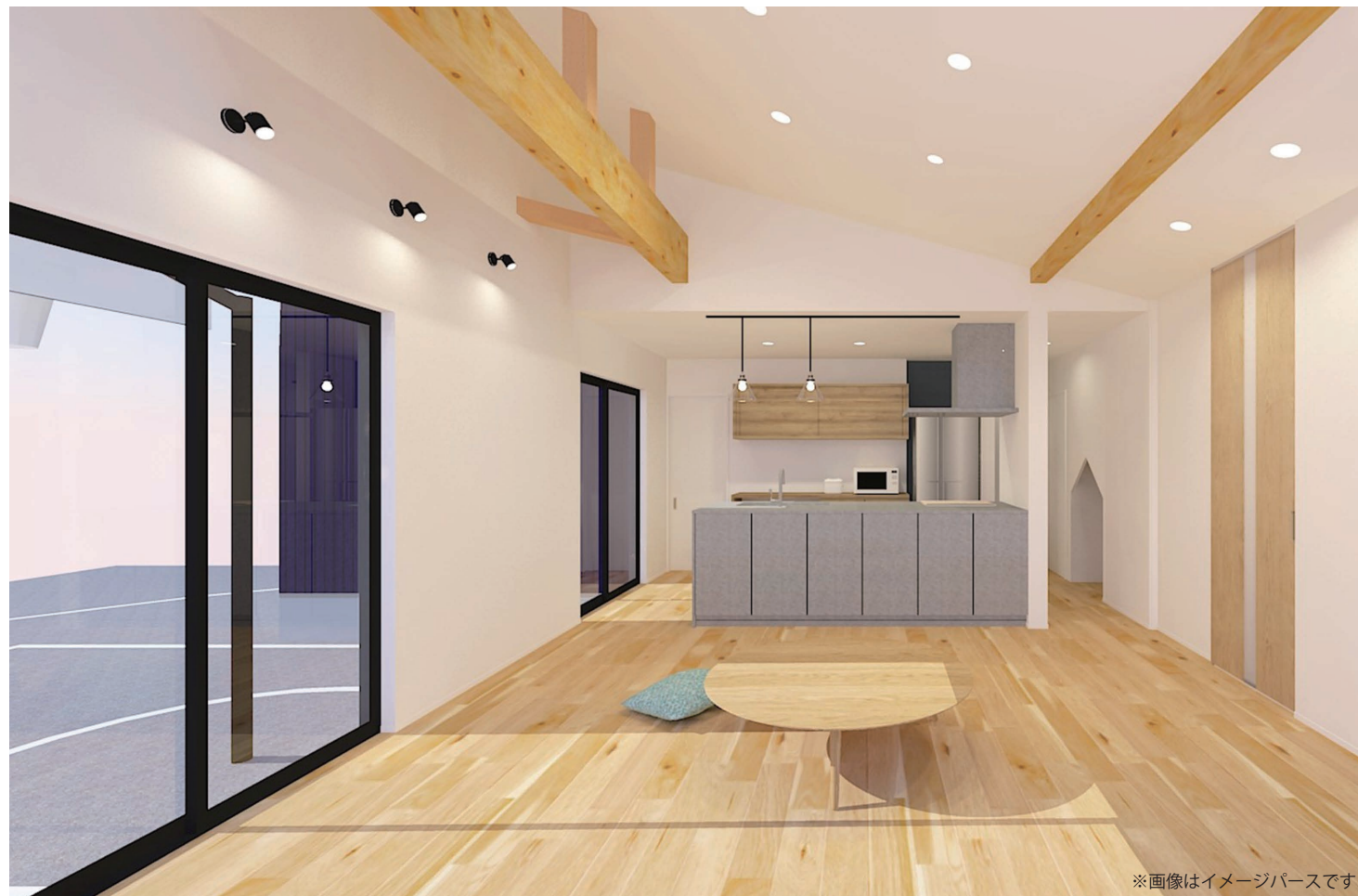
※画像はイメージパースです