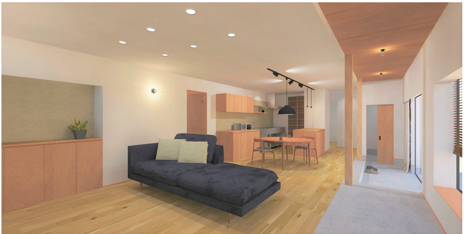
※この画像はイメージバースです