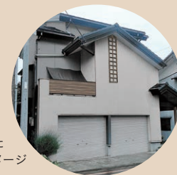
ソフトで作成した完成イメージ

外観の色決めですが、小さなサンプルではなかなか完成後を想像できません。そこで、外観写真をもとにイメージを作れるソフトでリアルなイメージを確認いただいております。色だけではなく、張替工事にも対応しており、違うデザインの外壁を写真に張り付けたり、手摺も変更することができます。こうして、イメージに近い仕上がりとなるよう工事をさせていただいております。