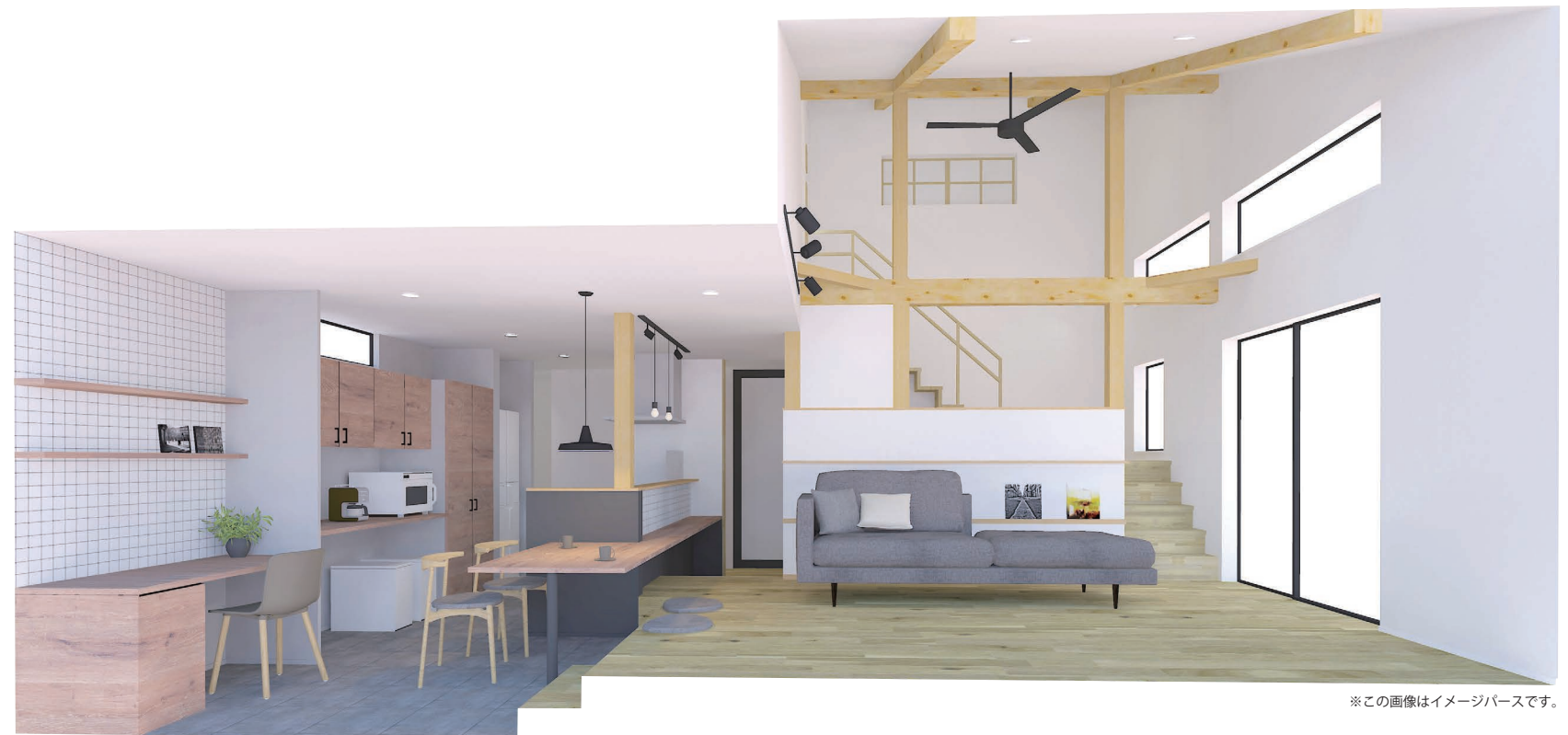
※この画像はイメージパースです。