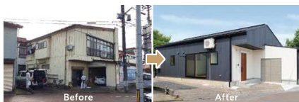
2階減築を行い平屋建てに生まれ変わりました