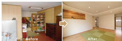
明るく大きなリビング。市松様様の畳や、飾り棚がアクセントです