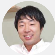
Takada Kenchiku Jimusho