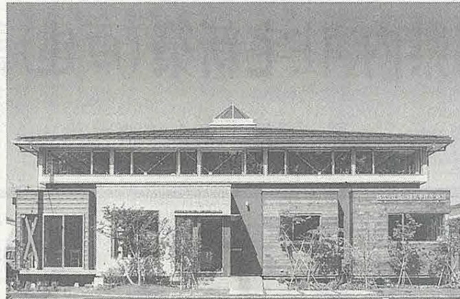
新潟営業所の社屋。コンセプトはアナザーロケット