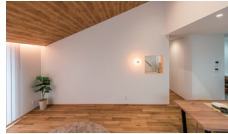
さんかく屋根の家