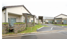
サポートセンター撰田屋