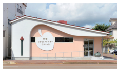
太田子どもとアレルギークリニック