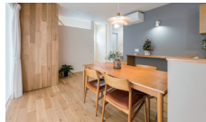
サンカク町の休日