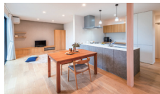
継承と新化のくらし