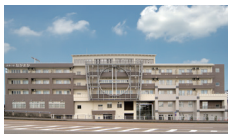
健康の駅ながおか