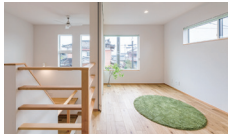
わんだフル・マジック