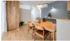
サンカク町の休日