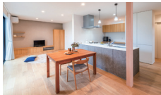
継承と新化のくらし