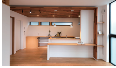
Our Own Taste