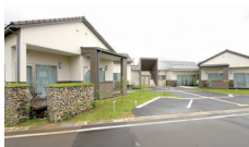
サポートセンター撰田屋