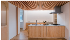
光そそぐ、ふたつの暮らし