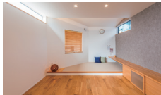
カッティングペイカー