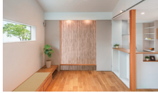
街中のサンクチュアリ