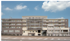
健康の駅ながおか