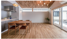
Gray to piano