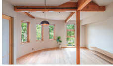
想いを伝承する家