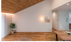
さんかく屋根の家