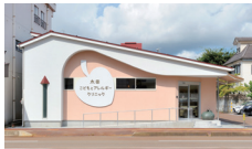
太田子どもアレルギークリニック