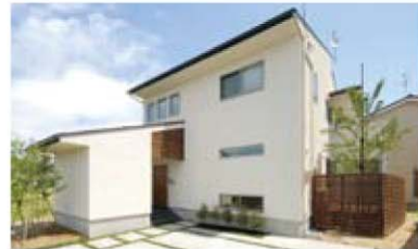
さくらテラスとさくらダイニング