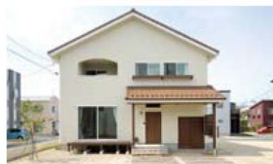
ほいぶクリームのおうち