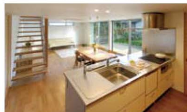
Court House L05