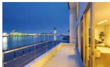
ミスターロンリーの家