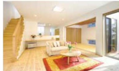
ものしり博士の家