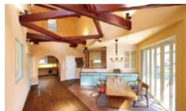
Hotel La Tavolozza W