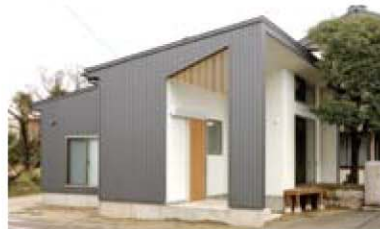
ハイカラさんの家