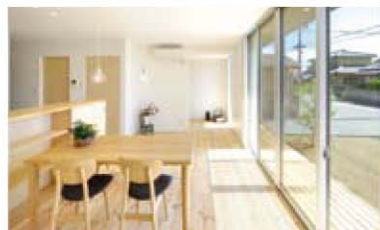
みんながかわら帽子をかぶる家