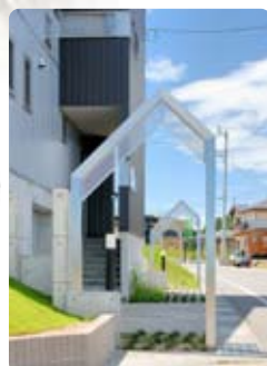
ゲートでまちに統一感を出す。

●物件種別/分譲住宅 ●物件所在地/新潟県長岡市陽光台3丁目3番2地 ●区画数/面積/265.01㎡(80.16坪)~279.27㎡(84.47坪) ●建物面積/103.09㎡(31.12坪)~138.79㎡(41.90坪) ●建築確認番号/第H20確認建築長岡市000625号他、平成20年9月19日 ●販売区画数/全12区画中3区画 ●価格/土地建物付2,383万円~3,039万円(税込) ●企画・建築設計・施工/(株)高田建築事務所 ●事業主・売主/(株)フォレス・タカダ ●都市計画/市街化区域 ●用途地域/第一種低層住居専用地域 ●建蔽率・容積率/50%・80% ●道路/長岡市道 ●道路幅員/約8m・約12m ●交通/長岡駅より12km、長岡駅より越後交通バス「陽光台3丁目」停留所まで30分、北陸・関越自動車道長岡インターチェンジまで車で約7分 ●施設概要/東北電力・北陸ガス・上水道・下水道 ●学区/青葉台小学校・青葉台中学校 ●近隣商業施設/国営越後丘陵公園、ひらせい、アクアール長岡